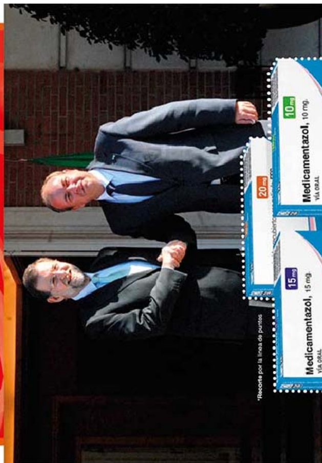
*Recorte por la línea de puntos

EL COPAGO FARMACÉUTICO DEL GOBIERNO DE RAJOY Y MONAGO